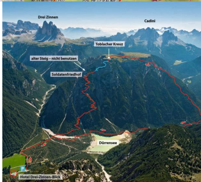
Seite 2 / Monte Piano – Hauptmann Bilgeri Steig