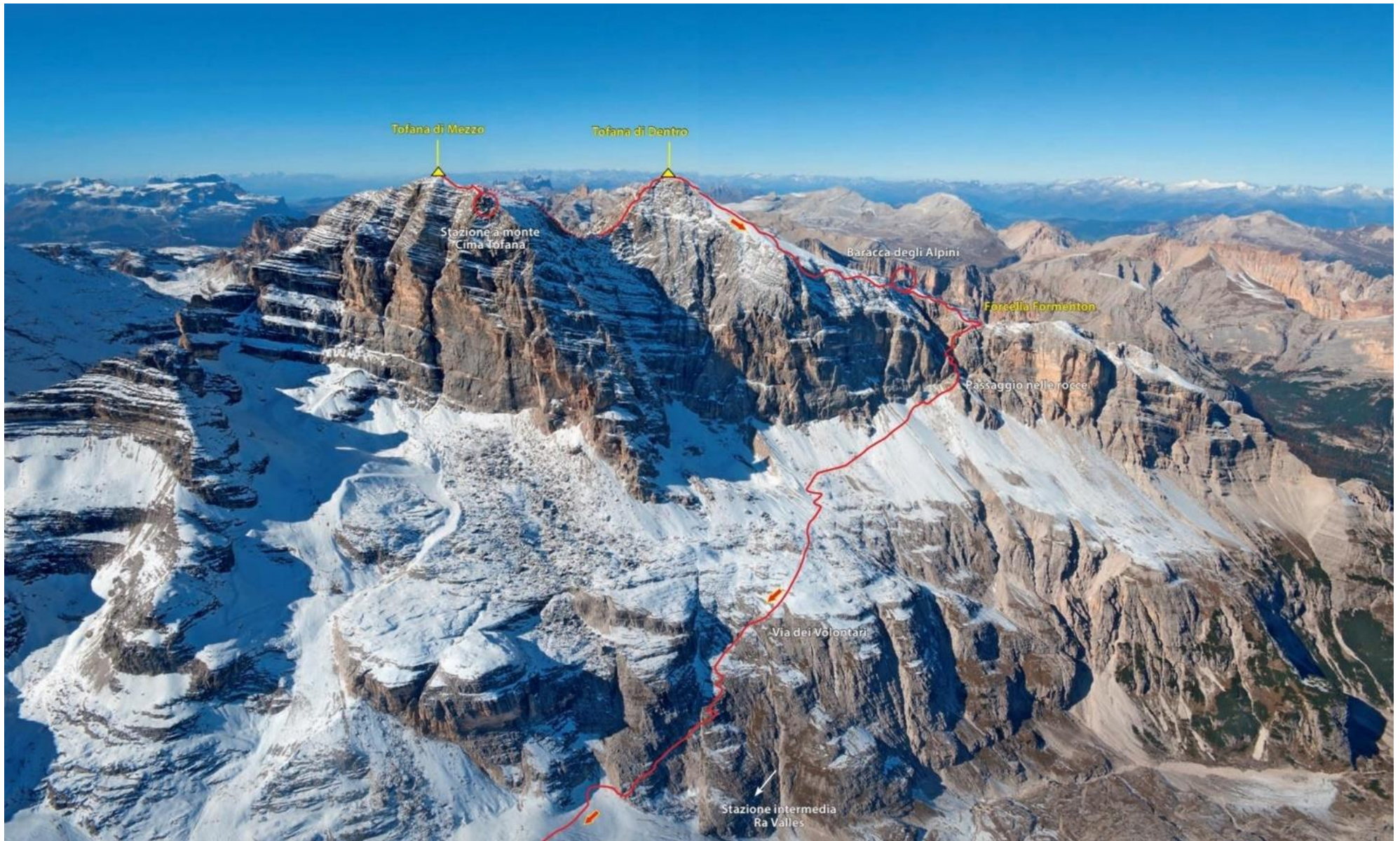
Seite 3 / Via Ferrata Formenton - Tofana di Dentro